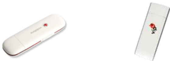
ZTE MF667 USB Stick

Uređaji poput USB stickova omogućavaju brz i jednostavan mobilni pristup internetu i/ili internoj uredskoj mreži vaše tvrtke (uz uslugu Korporativni pristup), putem najsvremenijih mobilnih mrežnih tehnologija. Vaše prijenosno računalo s podatkovnim uređajem i Vip podatkovnom tarifom može se spojiti na internet s područja gotovo cijele Hrvatske i iz inozemstva, iz mreža s kojima Vip ima roaming ugovore.